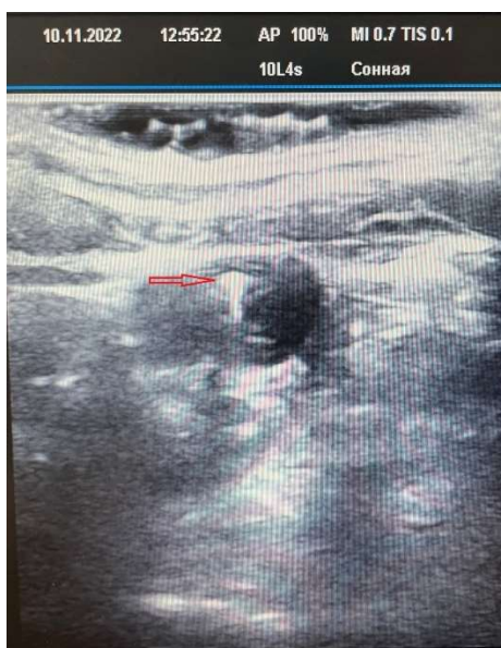
Рис. 6. Ультразвуковая картина положения металлического гибкого проводника (указан стрелками) в полости внутренней яремной вены при поперечном положении ультразвукового датчика.

Для контроля нахождения дистального конца пункционной иглы в полости сосуда проводится аспирационная проба. После чего через просвет иглы в полость сосуда вводится металлический гибкий проводник, контроль нахождения которого проверяется соноскопией в двух плоскостях (положение датчика поперечное и продольное) (рис. 6, 7).