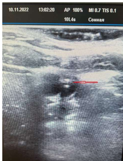
Рис. 9. Ультразвуковая картина положения катетера (указан стрелками) в полости внутренней яремной вены при поперечном положении ультразвукового датчика.