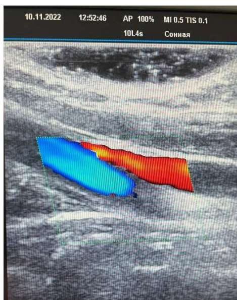
Рис. 3. Ультразвуковая картина идентификации внутренней яремной вены с помощью доплероскопии (синим цветом – общая сонная артерия, красным цветом – внутренняя яремная вена).

руется внутренняя яремная вена (рис. 3). После чего проводится пункция сосуда (рис. 4). Продвижение пункционной иглы также контролируется с помощью соноскопии. (рис. 5).