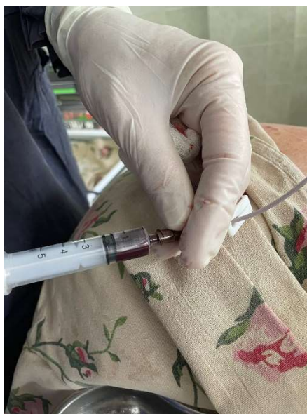
Рис. 8. Кровь шприцем аспирируется из катетера.

По методу Сельдингера по проводнику в полость сосуда проводится катетер на расстояние 14-18 см. так, чтобы дистальный конец катетера располагался в верхней полой вене перед входом в правое предсердие. Правильность стояния ЦВК проверяется путем аспирации крови из сосуда, через установленный катетер (рис. 8) и с использованием соноскопии в двух плоскостях (рис. 9, 10).