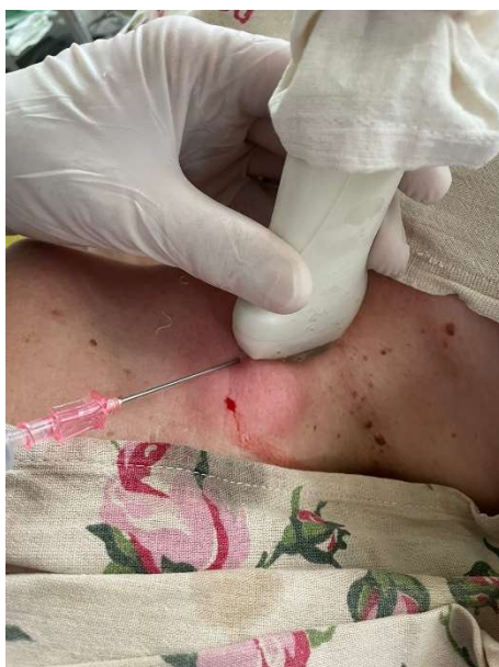
Рис. 4. Пункция внутренней яремной вены с использованием ультразвуковой навигации (положение ультразвукового датчика продольное).