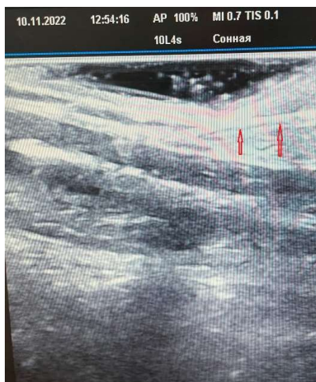
Рис. 5. Ультразвуковая картина пункции внутренней яремной вены при продольном положении ультразвукового датчика (игла указана стрелками).

Для контроля нахождения дистального конца пункционной иглы в полости сосуда проводится аспирационная проба. После чего через просвет иглы в полость сосуда вводится металлический гибкий проводник, контроль нахождения которого проверяется соноскопией в двух плоскостях (положение датчика поперечное и продольное) (рис. 6, 7).