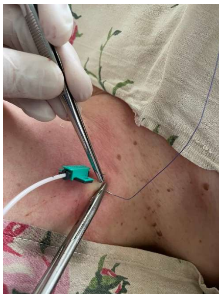
Рис. 11. Фиксация ЦВК шелковой лигатурой.

Для профилактики гнойно-септических осложнений место стояния катетера ежедневно обрабатывается антисептическим раствором со сменой асептической наклейки [20, 21]. В течение 6 ч после как удачной, так и неудачной попытки катетеризации центральной вены следует в обязательном порядке выполнить контроль с применением ультразвукового и/или рентгеновского исследования для исключения гемо/пневмоторакса [14, 22].