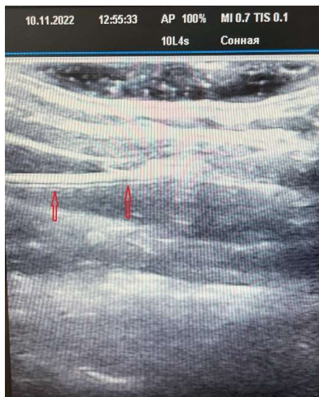
Рис. 7. Ультразвуковая картина положения металлического гибкого проводника (указан стрелками) в полости внутренней яремной вены при продольном положении ультразвукового датчика.

По методу Сельдингера по проводнику в полость сосуда проводится катетер на расстояние 14-18 см. так, чтобы дистальный конец катетера располагался в верхней полой вене перед входом в правое предсердие. Правильность стояния ЦВК проверяется путем аспирации крови из сосуда, через установленный катетер (рис. 8) и с использованием соноскопии в двух плоскостях (рис. 9, 10).