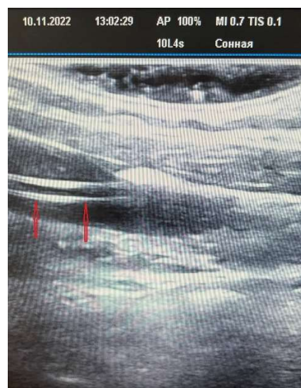
Рис. 10. Ультразвуковая картина положения катетера (указан стрелками) в полости внутренней яремной вены при продольном положении ультразвукового датчика.

Последующая фиксация ЦВК к коже осуществляется шелковой лигатурой (рис. 11).